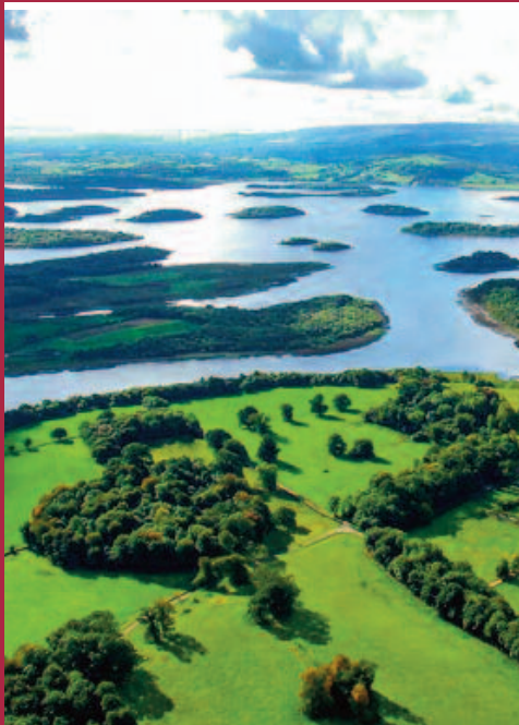
Belle Isle vue aérienne