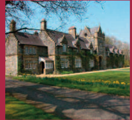
Baronscourt Tower House